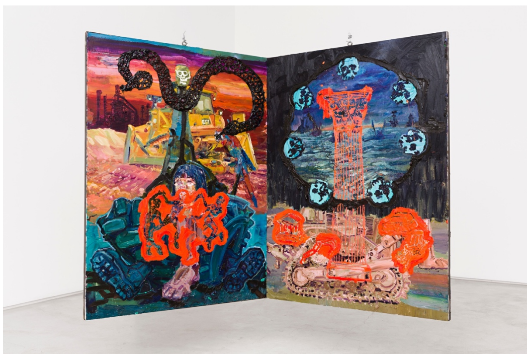
Teatro Nagô-Cartesiano: Água, Terra, Fogo, Fumaça e Correntes