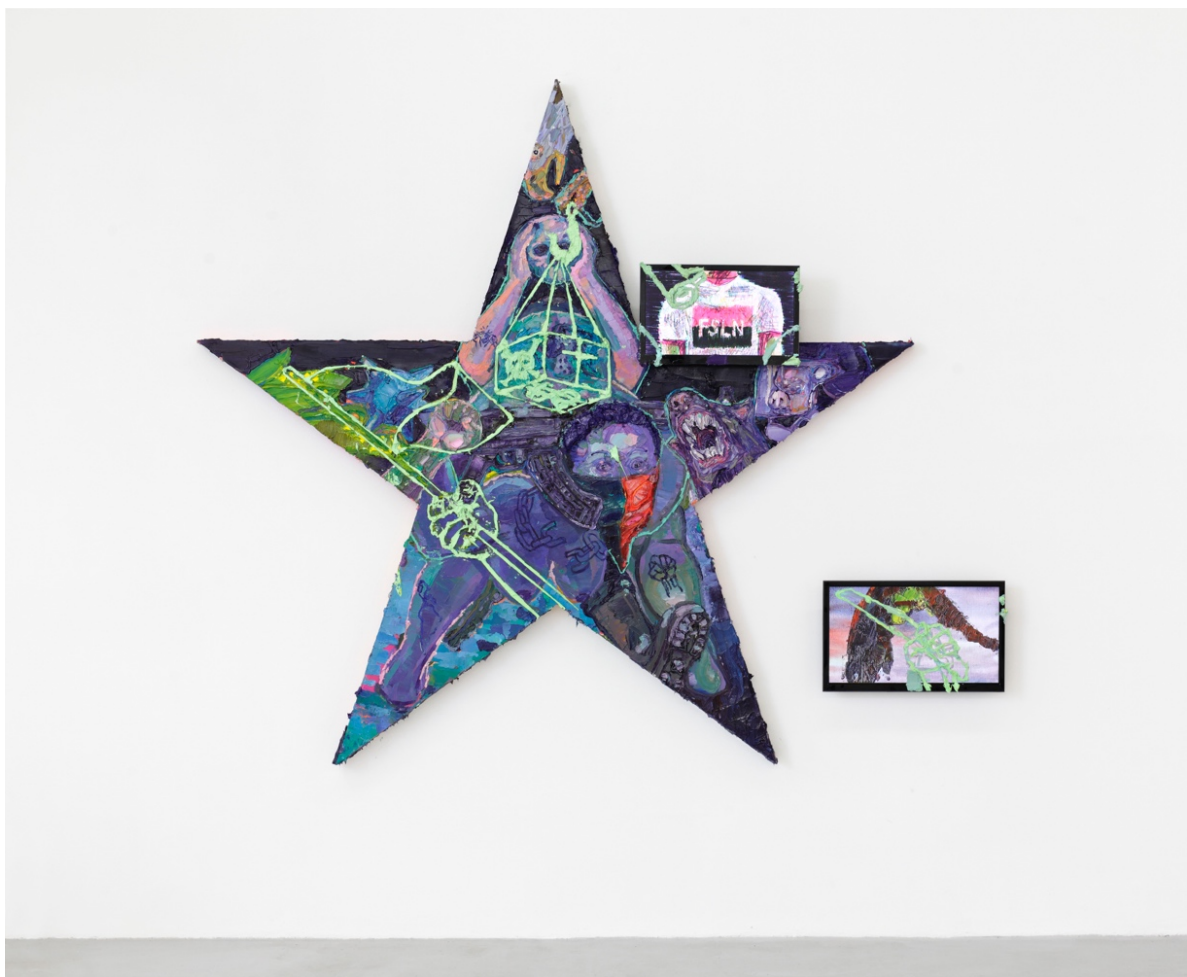
Crepúsculo imperial – camiseta de Marighella

óleo sobre tela e dois monitores de tv 18" e 21", animação stop motion