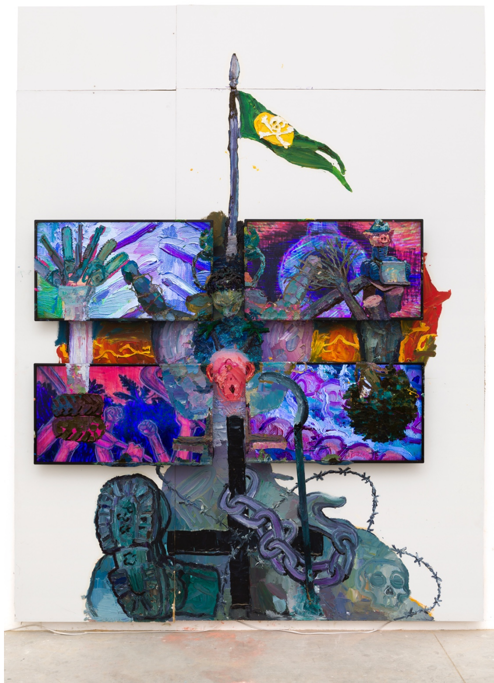
Teatro Nagoô-Cartesiano: A Cruz que penetra Pindorama

óleo sobre drywall, 4 monitores, animação stop motion poliuretano e ferro