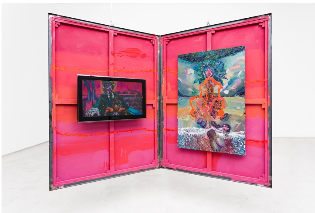
Teatro Nagô-Cartesiano: Água, Terra, Fogo, Fumaça e Correntes