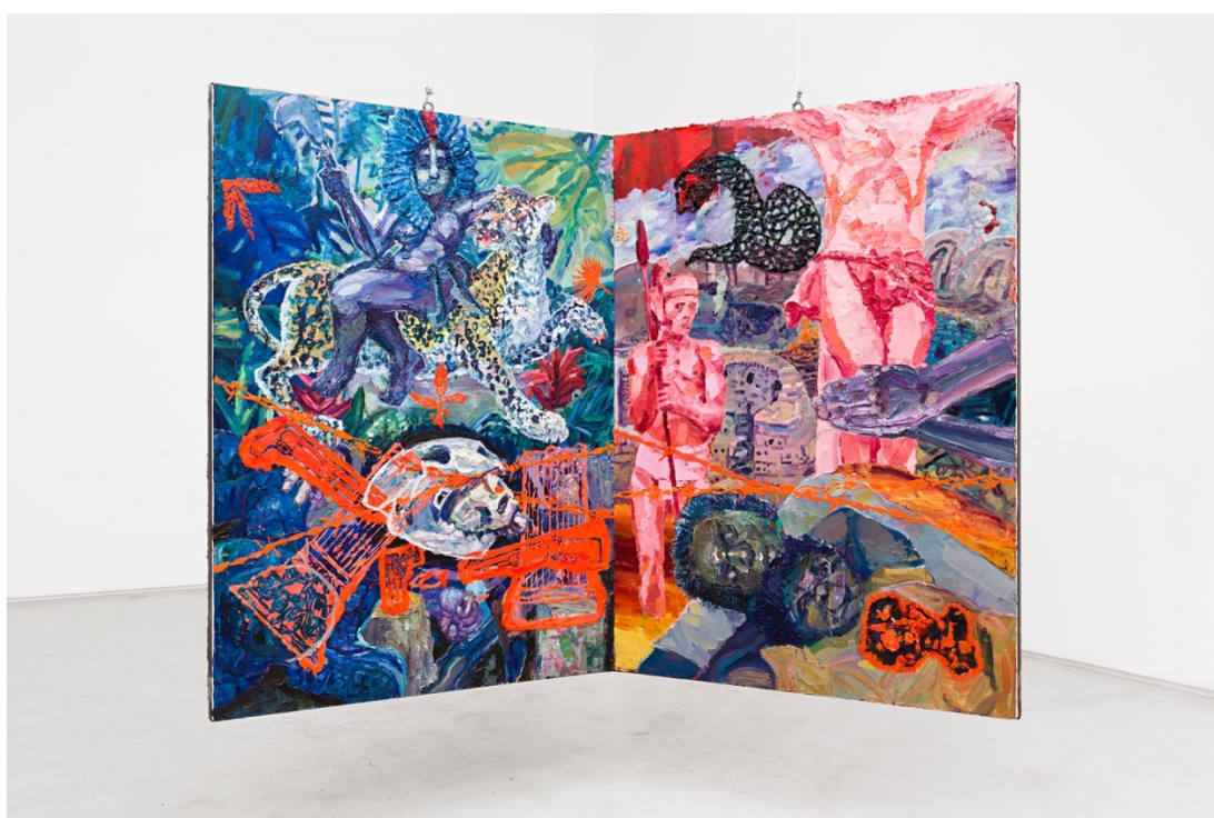
Teatro Nagô-Cartesiano: Água, Terra, Fogo, Fumaça e Correntes