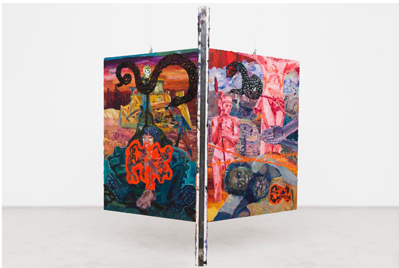
Teatro Nagô-Cartesiano: Água, Terra, Fogo, Fumaça e Correntes

óleo e acrílica sobre tela, ferro, tv 32", animação stop motion