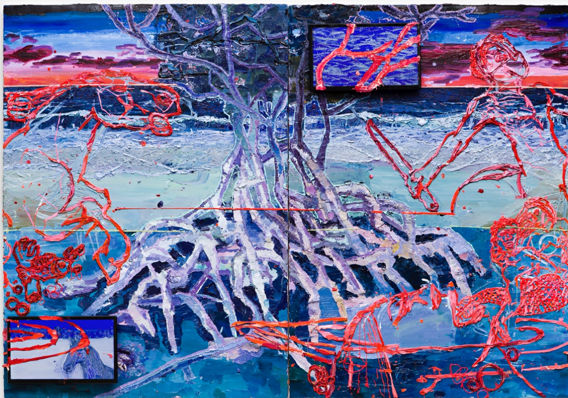
Teatro Nagô-Cartesiano: A Encantaria entre o Atlântico e o mangue é o caminho do Cavaleiro de Espadas

óleo sobre tela, dois monitores de tv 22", animação stop montion